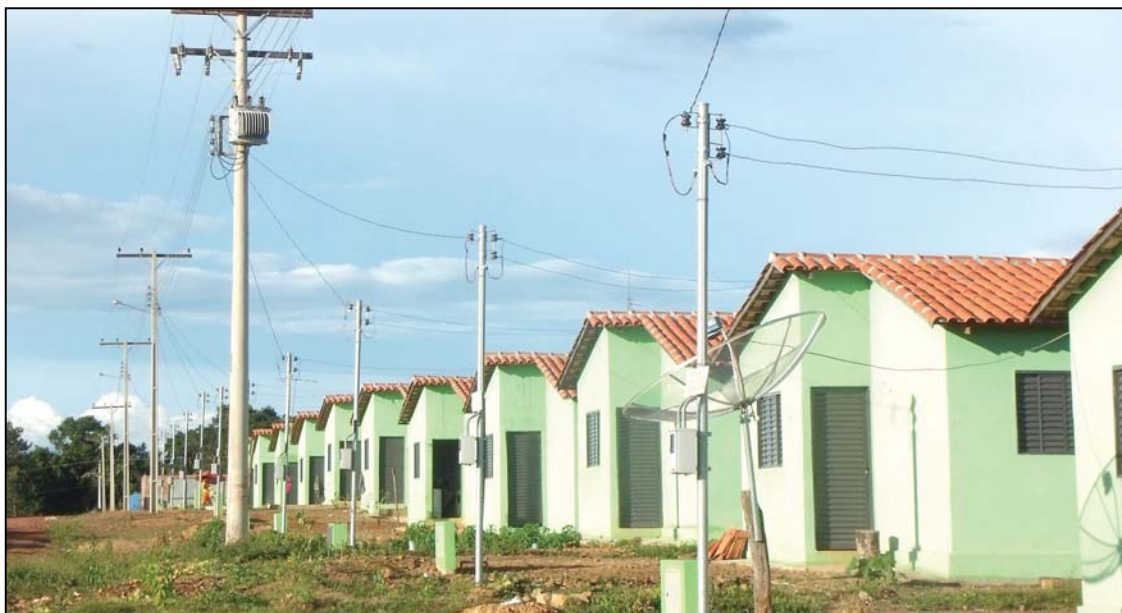
Visão parcial do Conjunto Habitacional Dovercino Borges após a conclusão das obras. 25 famílias carentes do município foram beneficiadas com a entrega das casas

Foram entregues 25 casas habitacionais com quatro cômodos e um banheiro. Dessas, apenas três foram respaldadas antes da troca de mandato, as outras ainda estavam em fase inicial. A partir de então, o respaldo foi concluído e a cobertura e acabamentos finalizados. O Prefeito Gaspar enfrentou desafios para instalar neste conjunto energia elétrica e água tratada, e hoje, 25 famílias carentes vivem no Conjunto Habitacional do Setor Dovercino Borges, com total qualidade de vida.