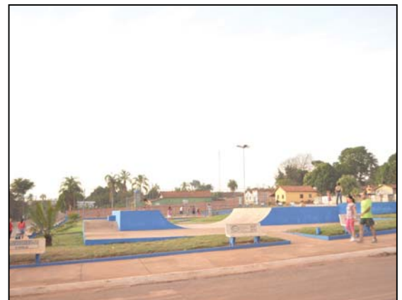
Hoje a mesma é usada pelas famílias como ambiente de lazer e espaço para caminhar