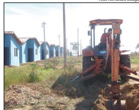
Conjunto Habitacional Dovercino Borges em dezembro de 2008 e durante as obras realizadas pela gestão do prefeito Gaspar Alves. São 25 unidades habitacionais que deveriam ter sido concluídas no pleito anterior