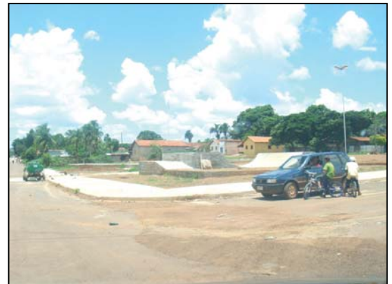
Inacabada, Praça do Setor Sudoeste servia de depósito de lixo em dezembro de 2008

A Praça Nova Republicana, que fica no centro da cidade e é referência para o doverlandense, também não foi esquecida, passou por reforma e ampliação, hoje é totalmente acessível aos cadeirantes. No estacionamento que nunca tinha sido usado desde a inauguração da praça, foi feito uma rampa e hoje todos podem estacionar seus veículos.