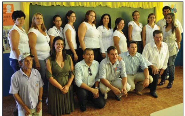
Reunião de educadores avalia a metodologia indicada para tratar de cada fase escolar do aluno