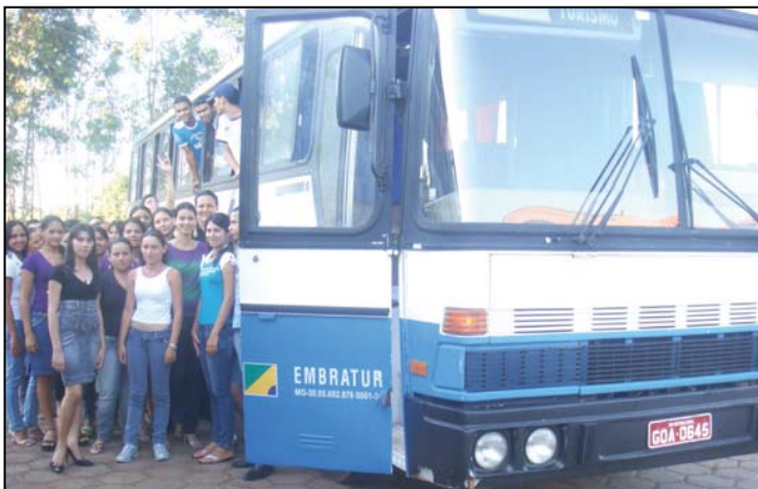
Os cerca de 80 universitários viajam diariamente para a cidade vizinha de Caiapônia sem nenhum custo