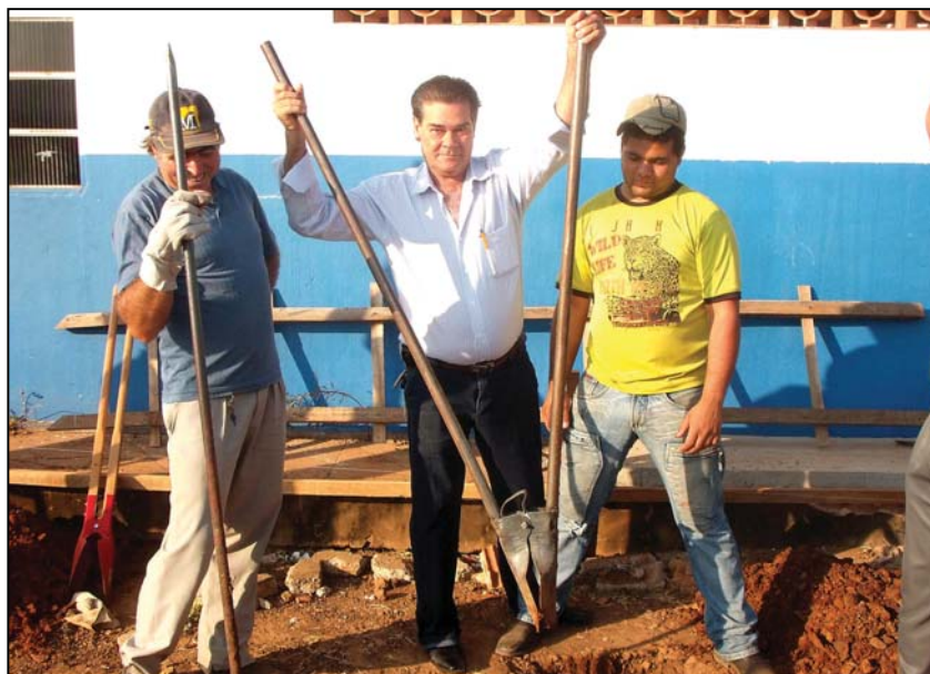
Prefeito Gaspar Alves dá ponta pé inicial e participa ativamente na fiscalização de todas as obras da administração 2009/2012