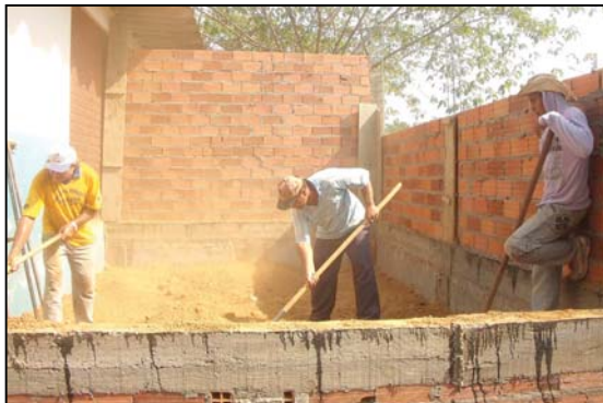
Todas as escolas municipais foram reformadas e receberam relevantes investimentos

Todas as escolas municipais foram equipadas com Máquina de Xerox, copiadoras, de última geração para realização dos trabalhos internos que antes eram feitos através de mimeógrafo.